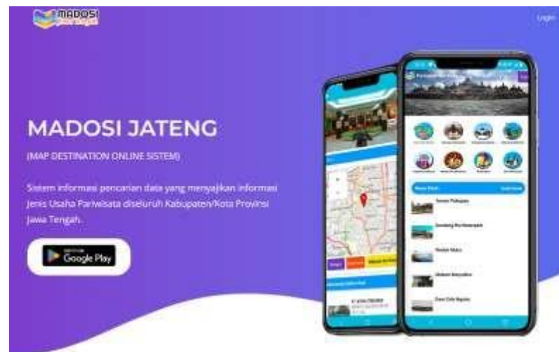
Gambar 3.1 Madosi Jateng

Aplikasi "Madosi Jateng" atau Map Destination Online Sistem Jawa Tengah merupakan aplikasi yang menyediakan informasi mengenai lokasi wisata, penginapan, tempat makan dan minum serta hiburan di kota tujuan. Aplikasi sistem informasi ini, menyajikan 13 jenis usaha pariwisata di seluruh kabupaten/kota di Jateng yang dapat mempermudah wisatawan untuk mengetahui posisinya dan dapat dengan mudah mengakses tempat-tempat wisata di Jawa Tengah. Layanan tersebut memungkinkan masyarakat bisa berselancar di dunia maya untuk mendapatkan berbagai jenis usaha pariwisata. Selain itu, wisatawan juga dapat memantau melalui ponsel, penyelenggaraan kegiatan hiburan dan rekreasi, penyelenggaraan pertemuan, perjalanan intensif, konferensi dan pameran, jasa informasi pariwisata, jasa konsultan pariwisata, jasa pramuwisata, wisata tirta, dan spa.